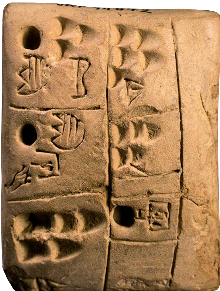
Hlinené tabuľky z Uruk z konca 4. tisícročia pred n. l.

Už viackrát v súvislosti s opisom Mezopotámie používam vo svojich príspevkoch slová Jorgea Luísa Borges: „Orient je miesto, kde vychádza slnko. Mezopotámia je jeho neodmysliteľnou súčasťou. Existuje podnetný nemecký výraz na označenie Orientu, ktoré mám záujem pripomenúť: Morgenland – Zem rána.“ Toto pomenovanie, aj keď Borges ho vyjadril najmä v iných dejinných a kultúrnych súvislostiach, výrazne naznačuje odkaz tematického zamerania akejkoľvek mojej práce alebo príspevku zaoberajúcim sa starovekými civilizáciami Blízkeho východu, Egypta a východného Stredomoria. Preto ma tieto Borgesove slová sprevádzajú vo viacerých mojich článkoch a štúdiách ako memento poznania oblasti, v ktorej sa pohybujem.