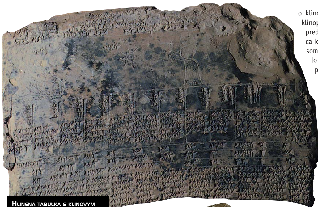
HLINENÁ TABUĽKA S KLINOVÝM PÍSMOM POCHÁDZAJÚCA Z MESTA URUK

kultúrou. Ak sa stotožníme s tvrdením, že jej nositeľmi boli etnickí Sumeri, tak za objaviteľov písma s najväčšou pravdepodobnosťou môžeme pokladať práve ich. Z mesta Uruk máme doložené najstaršie písomné pamiatky možno nielen z celej Mezopotámie, ale z celej Zeme. Pochádzajú z obdobia 3500/3300 – 3200 pred n. l. Približne 80 percent z nich tvorili hospodárske záznamy. Tieto najstaršie doklady písma pochádzajú z archeologických vrstiev Uruk IVa a III z posvätného miesta Eanna.