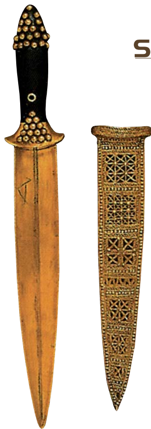
DÝKA Z KRÁLOVSKÝCH HROBOV V MESTE UR. POŠVA DÝKY JE VYROBENÁ ZO ZLATA, PRÍČOM JE ZDOBENÁ DEKORATÍVNYM LEMOVANÍM. RUKOVÄŤ JE VYROBENÁ Z LAPIS LAZULI. VÝROBOK POUKAZUJE NA KOVOLEJÁRSKE A KOVOTEPECKÉ UMENIE SUMEROV. ARTEFAKT POCHÁDZA Z I. DYNASTIE MESTA UR, Z PRVEJ POLOVICE 3. TISÍCRÓČIA PRED N. L.

mezopotámskeho priestoru. Tie ho však spočiatku podstatným spôsobom nepoužívali. Počas obdobia uruckej kultúry (4. tisícročie pred n. l.) sa začal používať rýchlo rotujúci hrnčiar-sky kruh, čo bola výrazná inovácia pri výrobe keramiky.