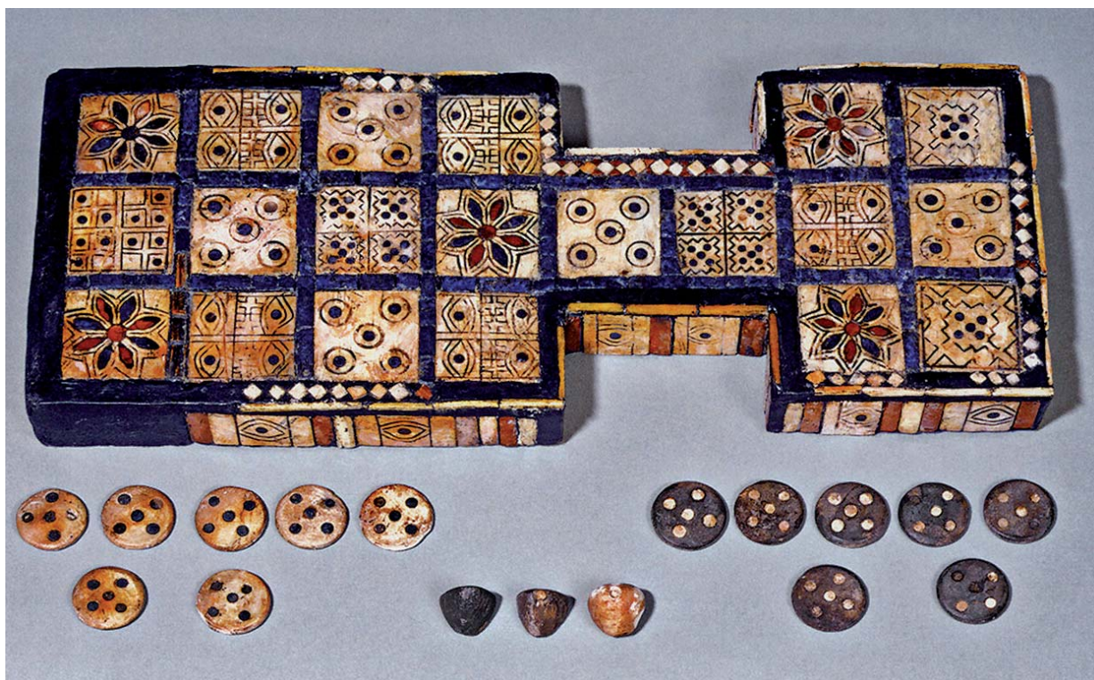
SPOLOČENSKÁ HRA Z MESTA UR ZO VČASNODYNASTICKÉHO OBDOBIA III.

zavedenie vydržalo do polovice 3. storočia pred n. l. Aktivita tejto služby súvisela najmä s pozorovaním Mesiaca, Slnka, ich zatmení, ale slúžila aj na upresňovanie termínov v lunárnom kalendári. Nesmieme však zabúdať, že astronomické skúmanie malo značne religiózny charakter. ➤